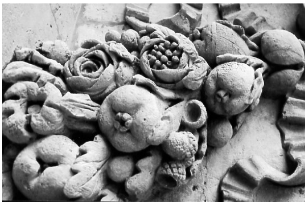
Détail architectural de l'église du Val-de-Grâce